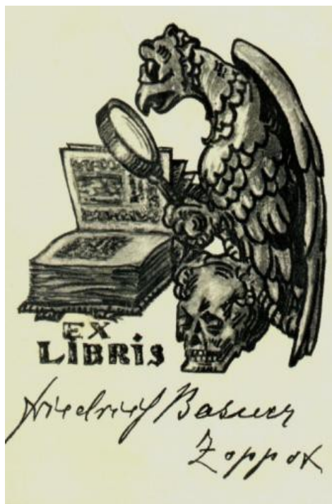
Eklibris Friedricha Basnera