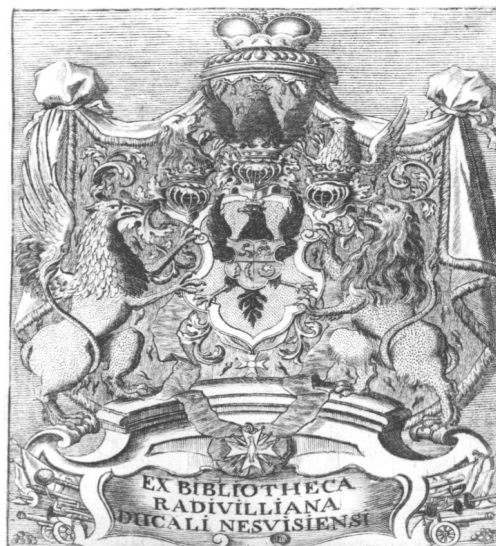
„Ekslibris biblioteki Radziwiłłów w Nieświeżu”, grafika ze zbiorów Biblioteki Narodowej w Warszawie. Biblioteka książąt Radziwiłłów w Nieświeżu, ongiś największa biblioteka prywatna w Rzeczypospolitej Obojga Narodów, powstała w XVI stuleciu, staraniem braci Radziwiłłów – Mikołaja Krzysztofa „Sierotki” (1549 – 1616) i kardynała Jerzego (1556 – 1600), synów wojewody wileńskiego Mikołaja, zwanego Czarnym.